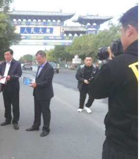
邢台市应急管理局（地震局）